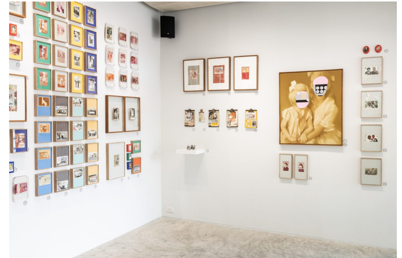
THE L_ST ALBUM. Pariwat Solo exhibition