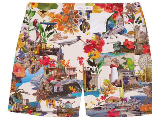
02. ORLEBAR BROWN