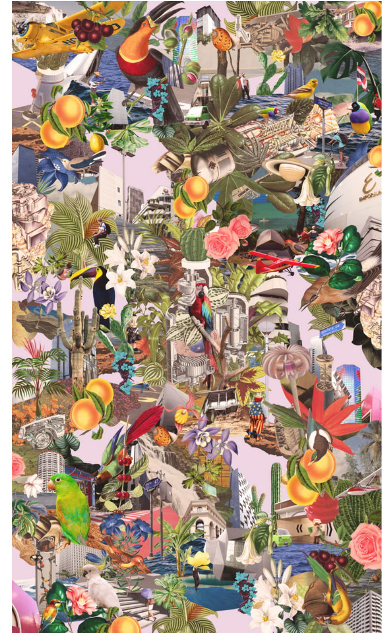
03. The Hybrid Garden ( 商業施設 )