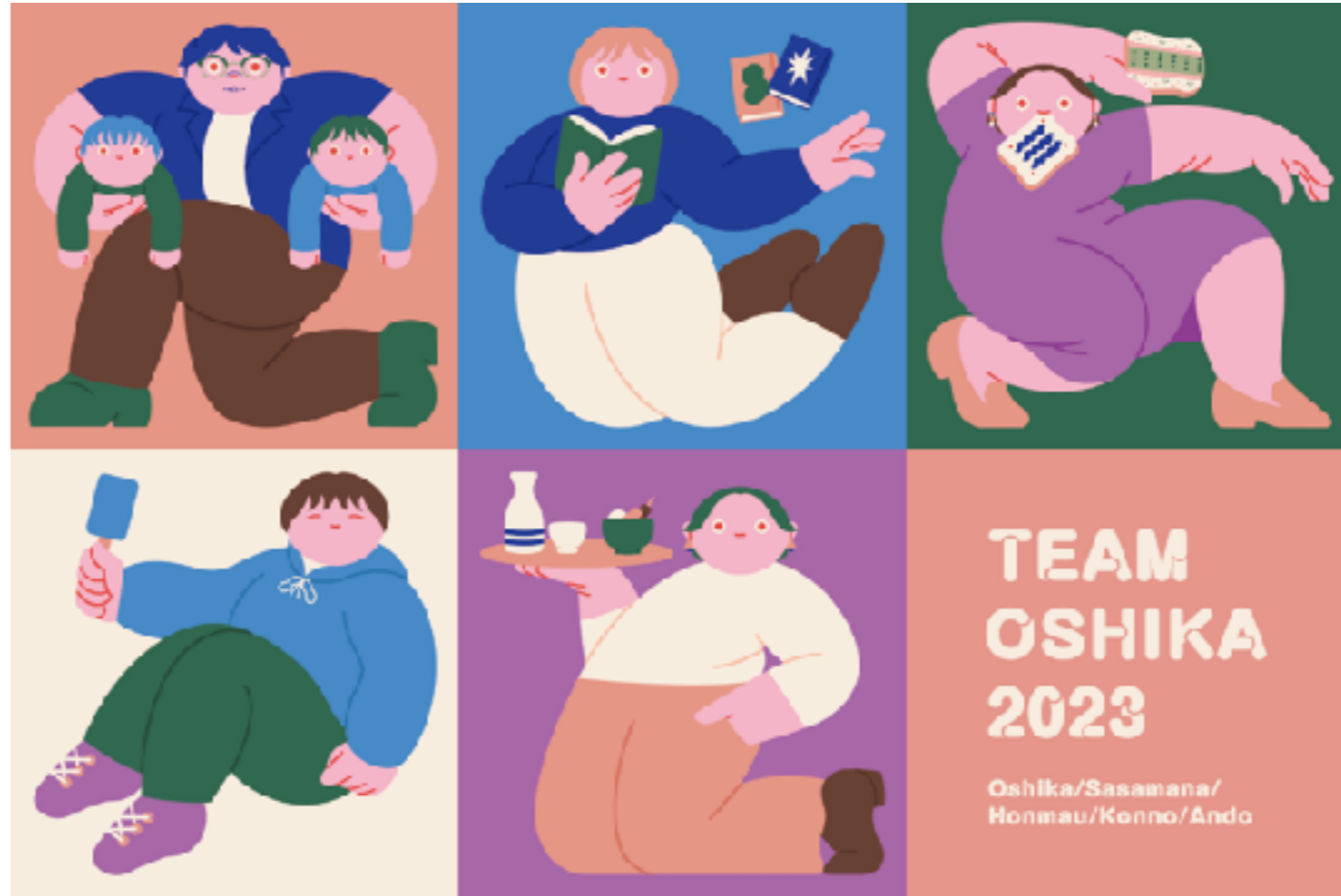
株式会社コンセント 大鹿チーム似顔絵