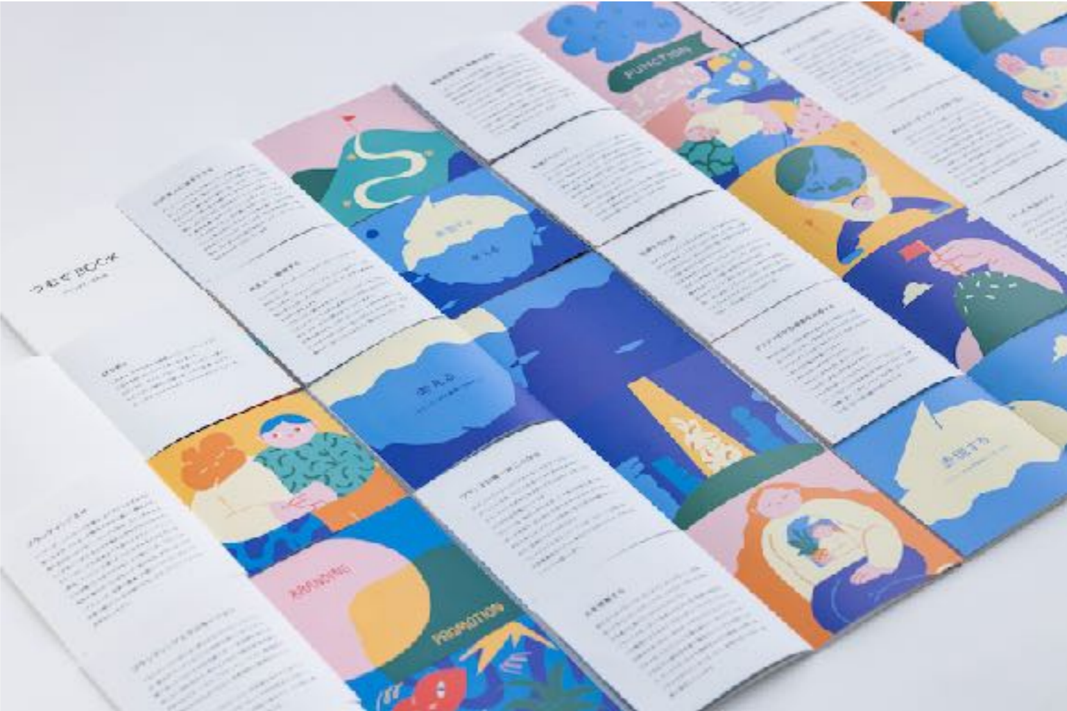
つむぐ inc ブランドブック挿絵