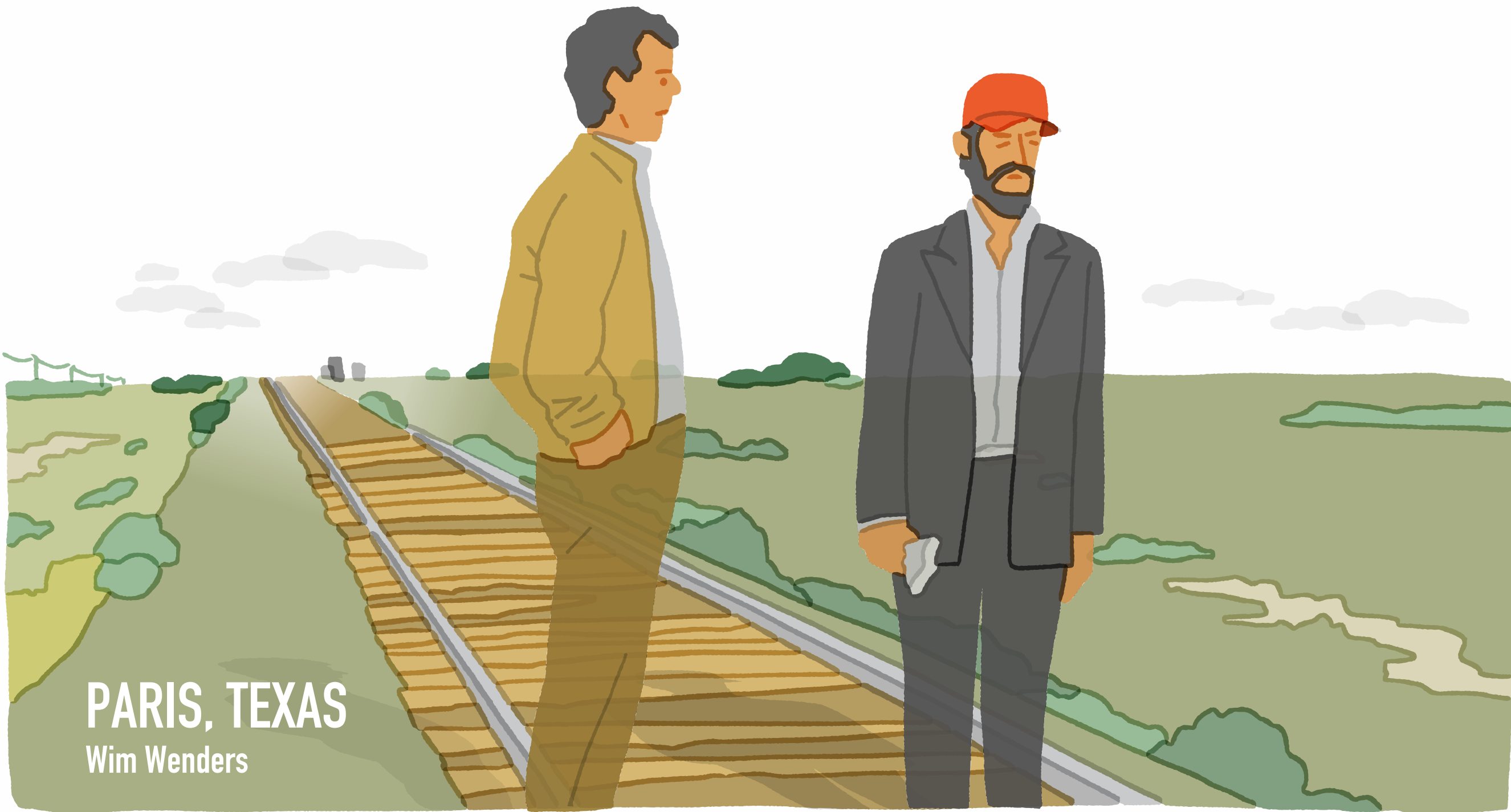
PARIS, TEXAS Wim Wenders